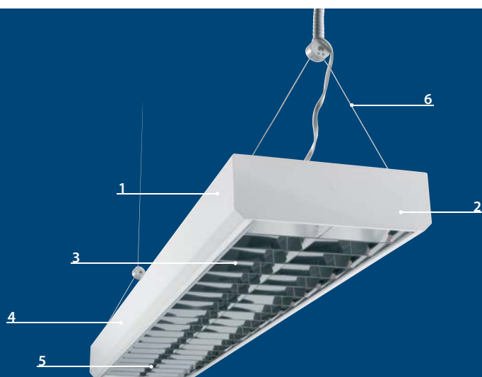
lineární zářivka T8 36W (G13)