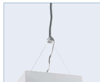
Určená pro zavěšení pomocí lankových závěsů.