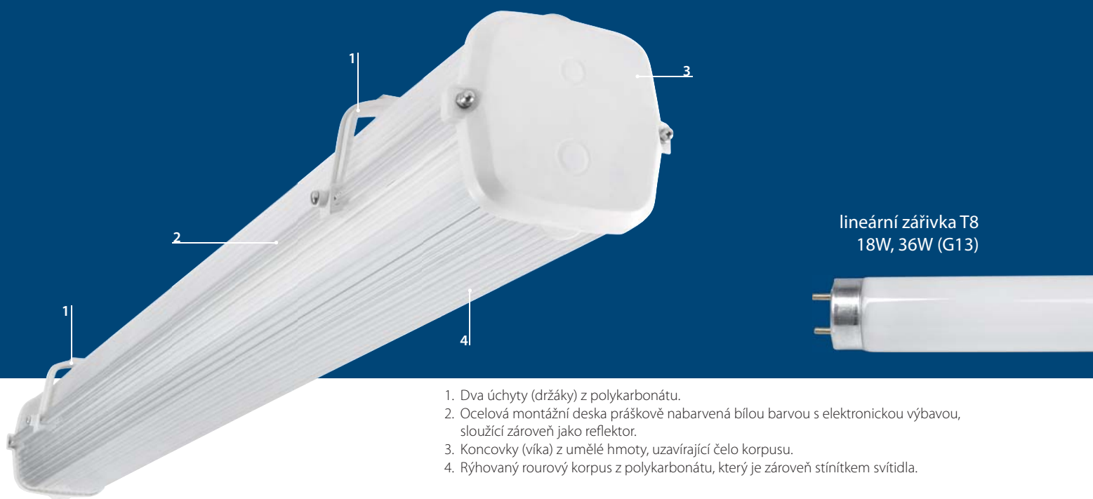
lineární zářivka T8 18W, 36W (G13)