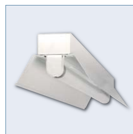
Model pro jednu lineární zářivku T8.